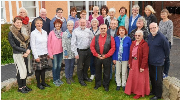
Ein Teil unseres Teams.

Inzwischen hat unser Ambulanter Hospiz-Dienst Husum und Umgebung e.V. 180 Mitglieder, davon 35 aktive und zwei hauptamtliche Koordinatorinnen.