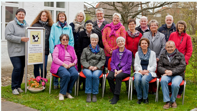
Ein Teil unseres Teams.

Inzwischen hat unser Ambulanter Hospiz-Dienst Husum und Umgebung e.V. 180 Mitglieder, davon 35 aktive und zwei hauptamtliche Koordinatorinnen.